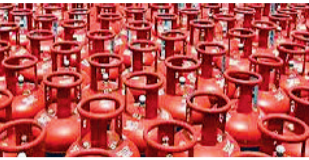
एजेंसी नई दिल्ली

पश्चिम एशिया संकट के बीच देश के पेट्रोलियम और प्राकृतिक गैस मंत्रालय ने कहा