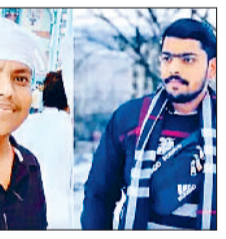
बड़े भाई का है एक साल का मासूम बेटा

चचेरे भाई की शादी से लौट रहे थे वापस, पातड़ा के गांव बंगरा बसेरा के पास दो गाड़ियों की भिड़त में गई जान