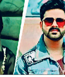
हरिभूमि न्यूज ▶▶ चंडीगढ़

हरियाणा महिला आयोग की चेयरपर्सन ने बादशाह के बाद अब भोजपुरी गायक व एक्टर पवन को नोटिस भेजकर तलब किया है। यह